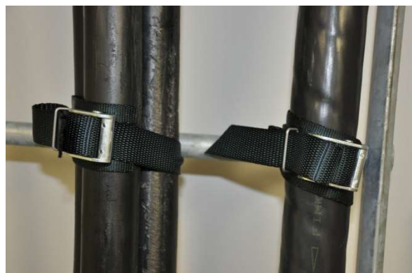
Trippelförband 1x150 CU AKKJ 4x150 AI